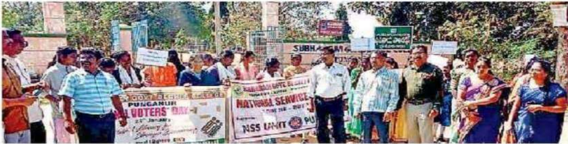
పుంగనూరు గ్రామీణ: ర్యాలీ నిర్వహిస్తున్న శుభారాం ప్రభుత్వ డిగ్రీ కళాశాల విద్యార్థులు